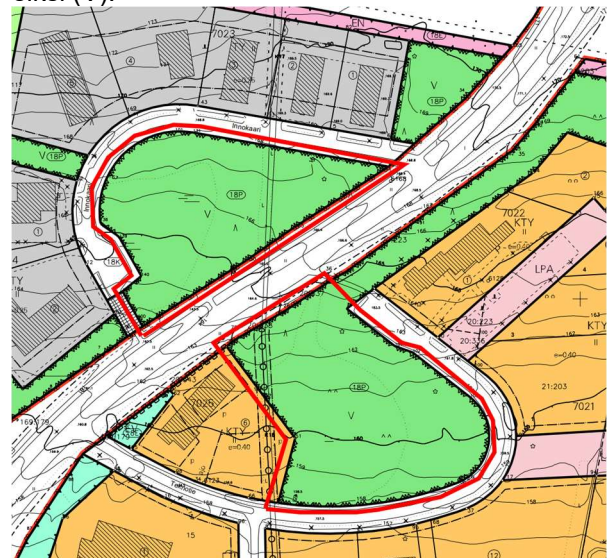
Kuva 4. Voimassa oleva asemakaava ja aluerajaus

Kaava alueilla on voimassa kunnanvaltuuston 19.6.2000 ja 19.5.2003 hyväksymät asemakaavat. Alueet on merkitty asemakaavassa virkistysalueiksi (V).