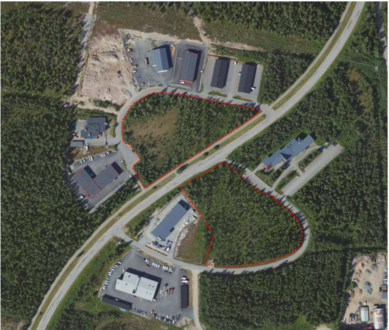
Kuva 1. Ilmakuva (2021) ja rajaus suunnittelualueesta

Seuraa suunnitteluhanketta: www.rovaniemi.fi/kaavatori