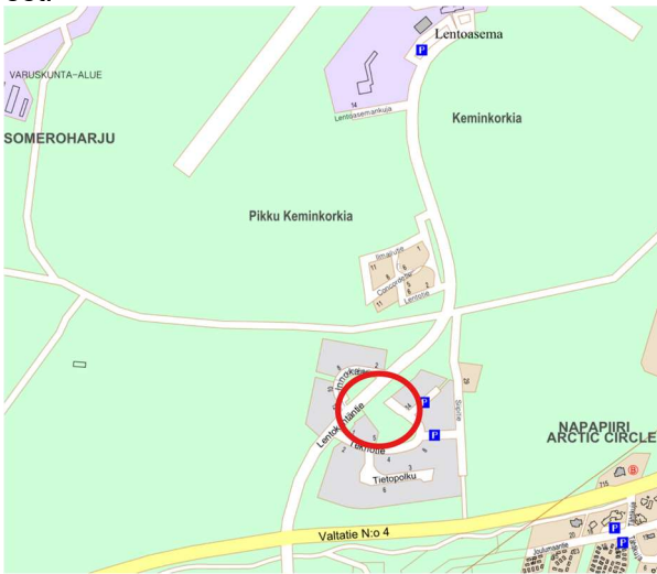
Kuva 2. Suunnittelualueen sijainti

Kaavamutosalue sijaitsee 18. kaupunginosassa Lentokentäntien ja Innokaaren sekä Teknotie ja Lentokentäntien välisellä alueella. Virkistysalueet rajoittuvat rakennettuihin katuihin. Vaikutusalue käsittää lähiympäristön kortteli- katu- ja virkistysalueet.